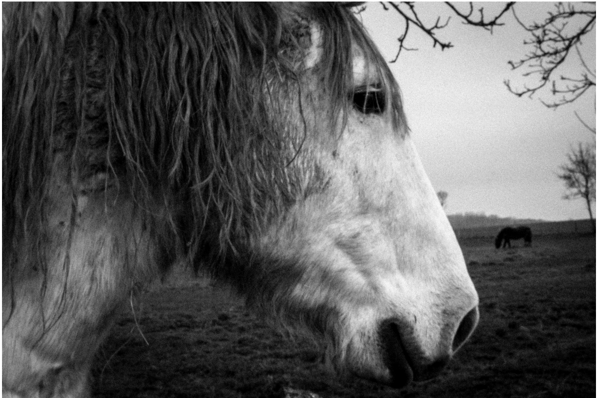
ĞRĪŞ, de profil

Ils rentrent au palais, traînant derrière eux le grand silure, qu'il faut amener aux cuisines du palais pour le repas du soir.