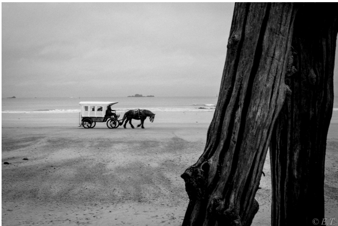
La roulotte des pillers d'épaves

ĞRĪŞ, le cheval, l'invite alors à monter sur son dos. Puis ils se dirigent, au pas, vers le palais de HEŇ.