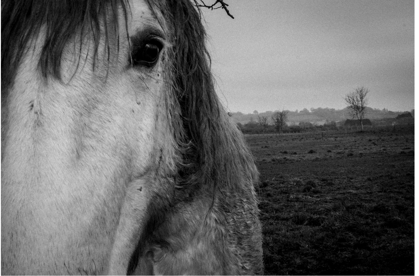
ĢRĪŠ, de face