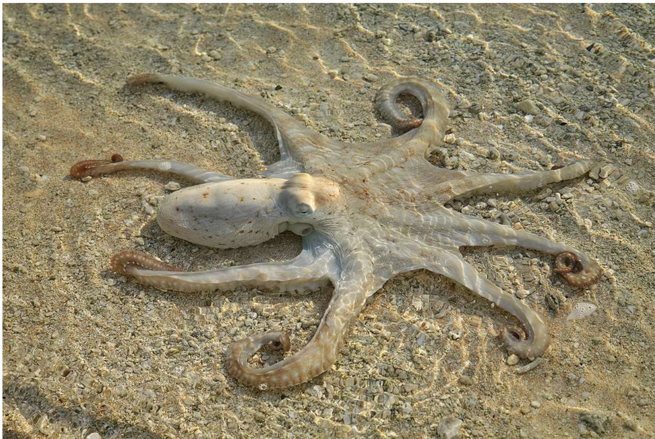
RÔÛL, le poulpe couleur de sable

Un bras démesurément long, pourvu de ventouses, lui a fait un méchant croche-pied, ou plutôt, puisqu'il lui a bloqué les deux pieds en même temps, un double-croche-pied, qui l'a envoyé, deux fois plus rapidement donc, voler un court moment dans l'air marin, et s'aplatir contre le sol.