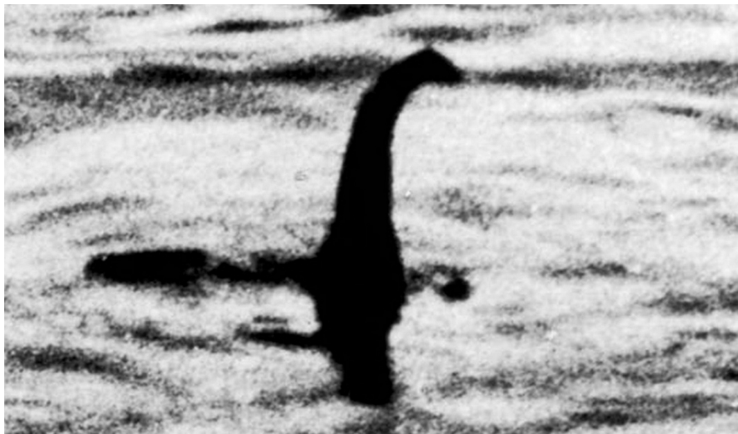
NĚĚŞŞĬ, le monstre du Loch Ness

« Ne serais-tu pas, demande ĞŖĪŞ, dans la langue des animaux, le cousin du vénérable NĚĚŞŞĬ, que j'eus plaisir à rencontrer dans le Haut Pays d'Écosse ? »