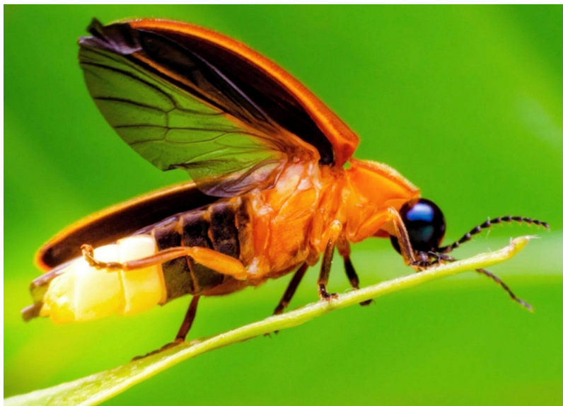
LÛÇĬ, luciole des livres

« Qui ose s'introduire dans mon royaume ? » siffle LÛÇĬ, la luciole.